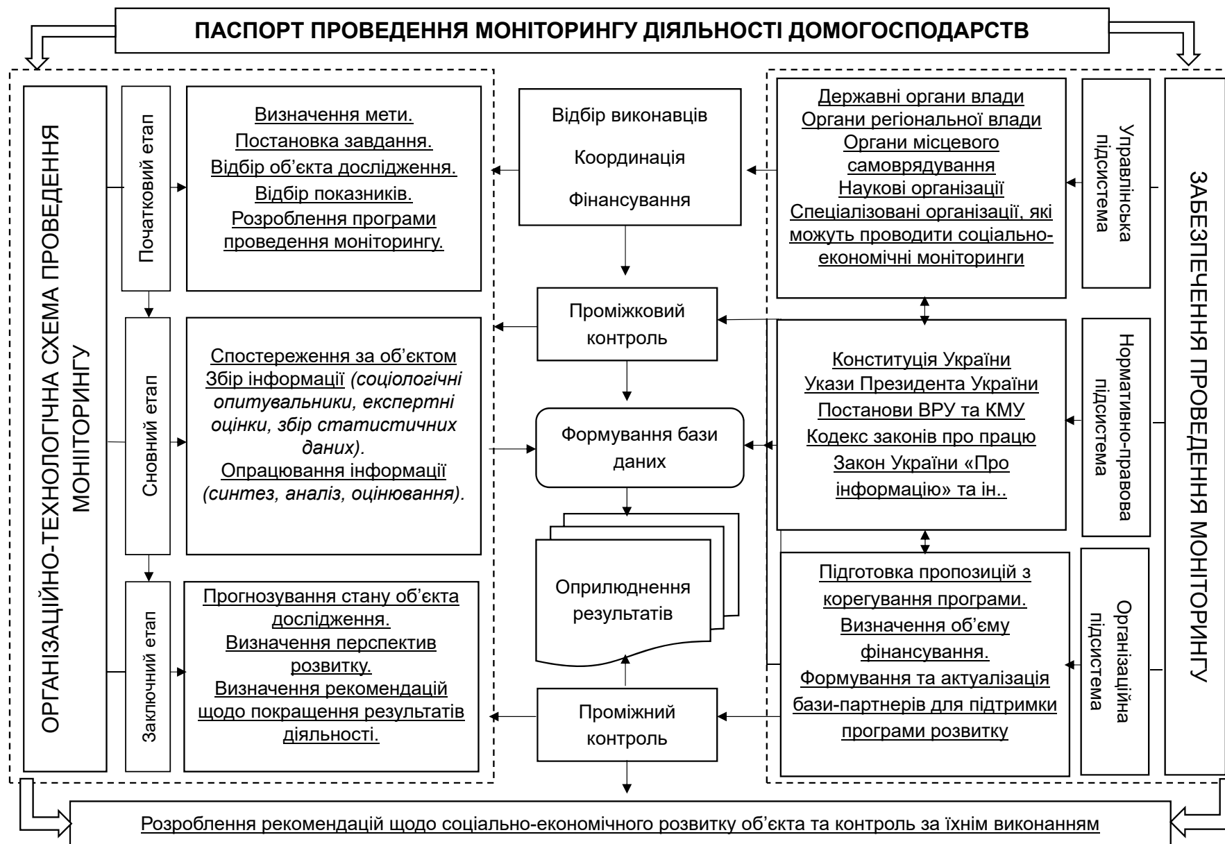
Рисунок 1. Паспорт проведення моніторингу соціально-економічної діяльності домогосподарств

Джерело: Систематизовано автором за джерелами [1, 2, 9].