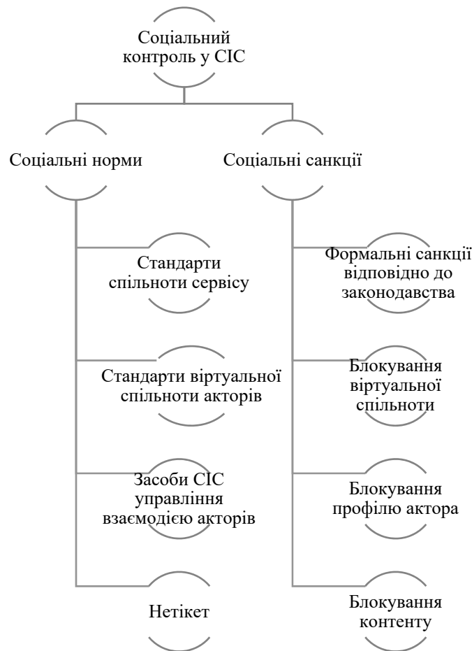
Рисунок 1. Базові компоненти соціального контролю в СІС

закріплення норм поведінки акторів, які є її учасниками. СІС мають розвинутий інструментарій для управління процесами взаємодії акторів, до яких належать засоби оцінювання коментарів і публікацій інших акторів, відгуки про сторінки або окремі дописи з можливістю поскаржитися на їх вміст, можливості блокування контенту, сторінок, акторів чи віртуальних спільнот тощо. Нетікет – сукупність загальноприйнятих правил поведінки у віртуальному просторі, дотримання яких акторами забезпечує створення комфортного середовища здійснення соціальної комунікації.