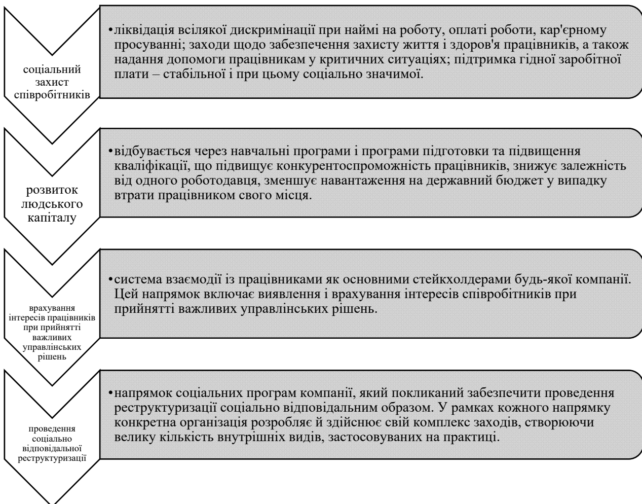
Рисунок 1. Напрямки соціальної відповідальності на підприємстві стосовно управління персоналом [17]

Соціально-відповідальний найм передбачає досягнення основних цілей наймання засобами, які передбачають дотримання моральних цінностей та повагу до людей, спільнот, що впливатиме на підвищення рівня якості трудового життя.