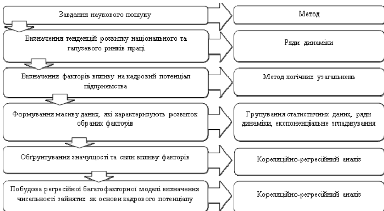
Рисунок 1. Методика формування моделі оцінювання рівня чисельності зайнятого населення в транспортній галузі

Ще однією важливою характеристикою ринку праці є рівень оплати праці, представлений середньомісячною заробітною платою, яка демонструє стабільну тенденцію до зростання протягом всього аналітичного періоду як в цілому по Україні (+133.61%), так і в сфері транспорту (+125.79%) в національній валюті. Але інфляційні процеси та девальвація негативно відображаються на цьому прирості, що нівелює його.