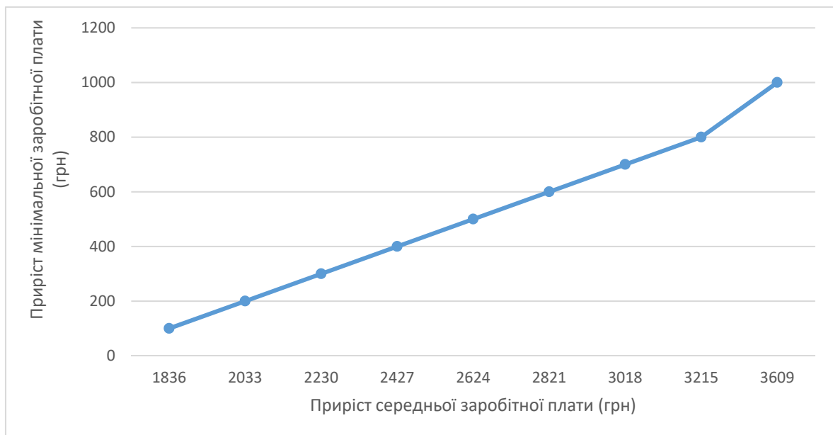
Рисунок 1. Залежність приросту середньої заробітної плати від приросту мінімальної (грн)

Таким чином навіть незначне підвищення мінімальної заробітної плати (наприклад, на 200 грн) призведе до суттєвого збільшення середньої (на 2.033 грн), а це, в свою чергу до зростання рівня цін на 12% (темпу росту середньої заробітної плати досягне 122\% (2.033 + 9.218) / 9.218 = 1.22 ), а приріст інфляції – 12.1\% (22\% * 0.55) .