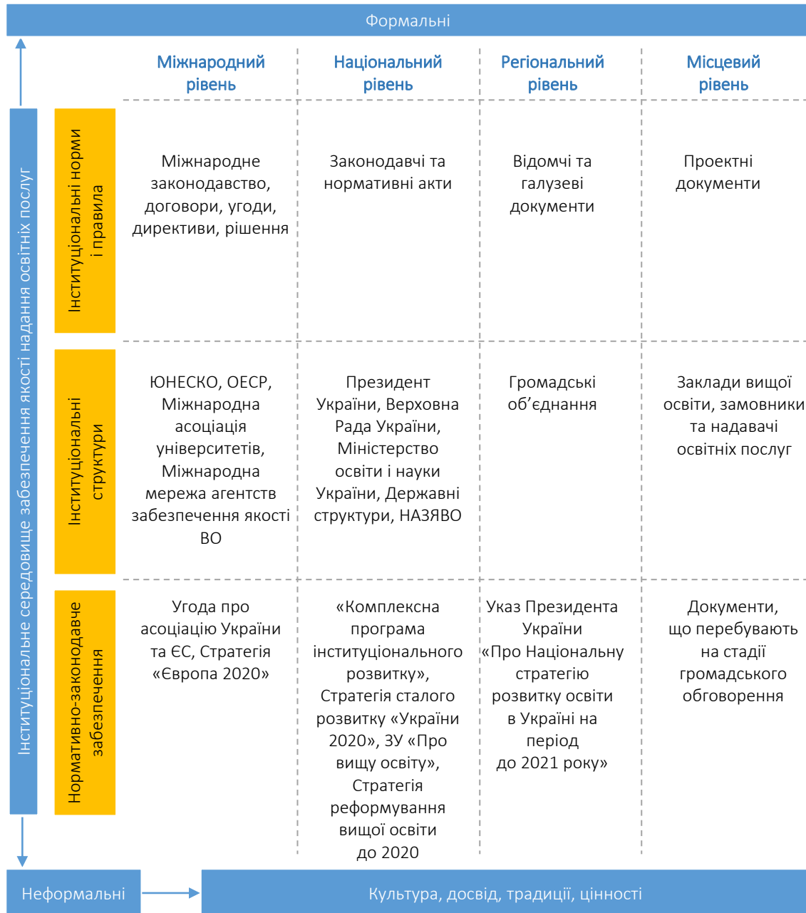
Рисунок 2. Інституціональні засади забезпечення якості вищої освіти